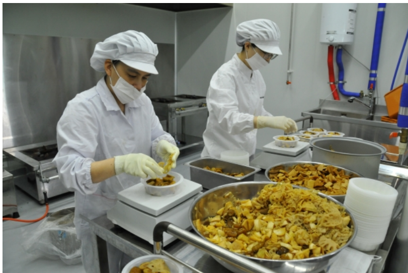
세종시 로컬푸드가공지원센터가 과채주스, 국수(숙면), 과자류 3가지 유형에 대한 식품위해요소중점관리기준(HACCP) 인증을 취득했다.