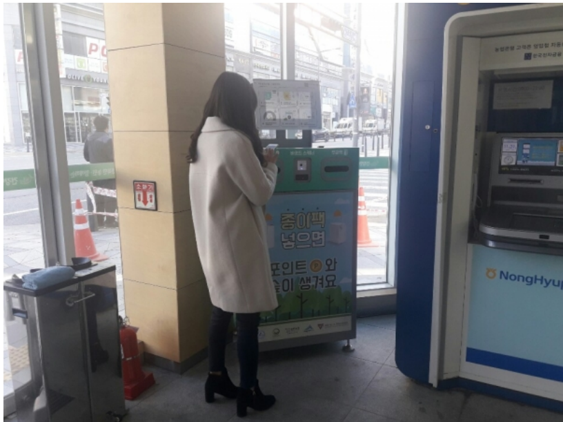
세종시가 종이팩이 일반종이류와 혼합 배출로 재활용되지 않는 상황을 개선하기 위해 사물인터넷(IoT) 활용 종이팩자동수거기를 확대 하기로 했다.